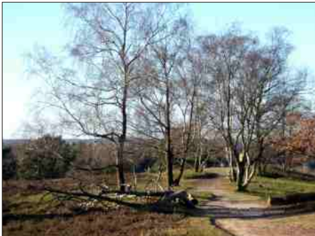
rund um den „Boxberg“